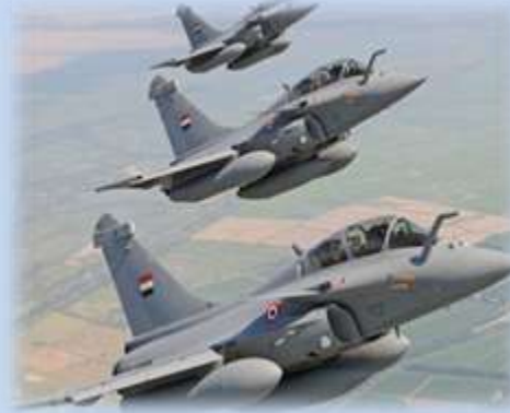
( طائرات الرافال طراز قديم وبها عيوب )