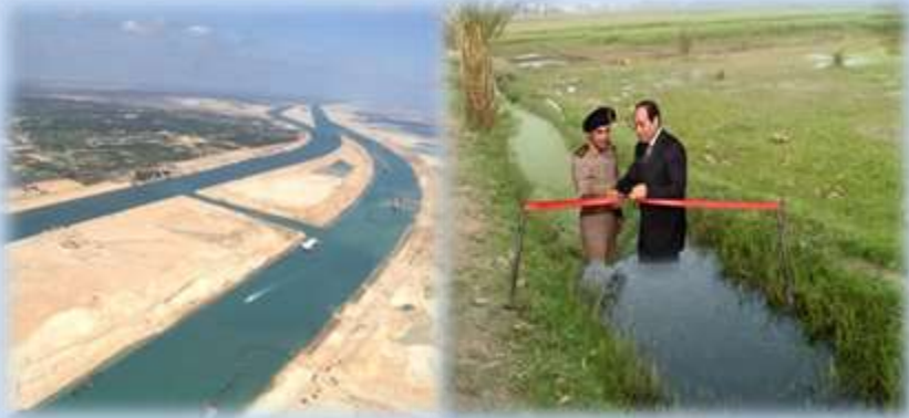
( قناة السويس الجديدة ترعة )

هى التى يتم ترويجها وإنتشارها ببطيء كالشائعات العدائية التى تستهدف القرارات السياسية والعسكرية بهدف ( التحقير منها - فقد الثقة - عرقلة خطوات التقدم الإقتصادى والسياسة - التشكيك فى قدرات وإمكانيات القوات المسلحة ) .